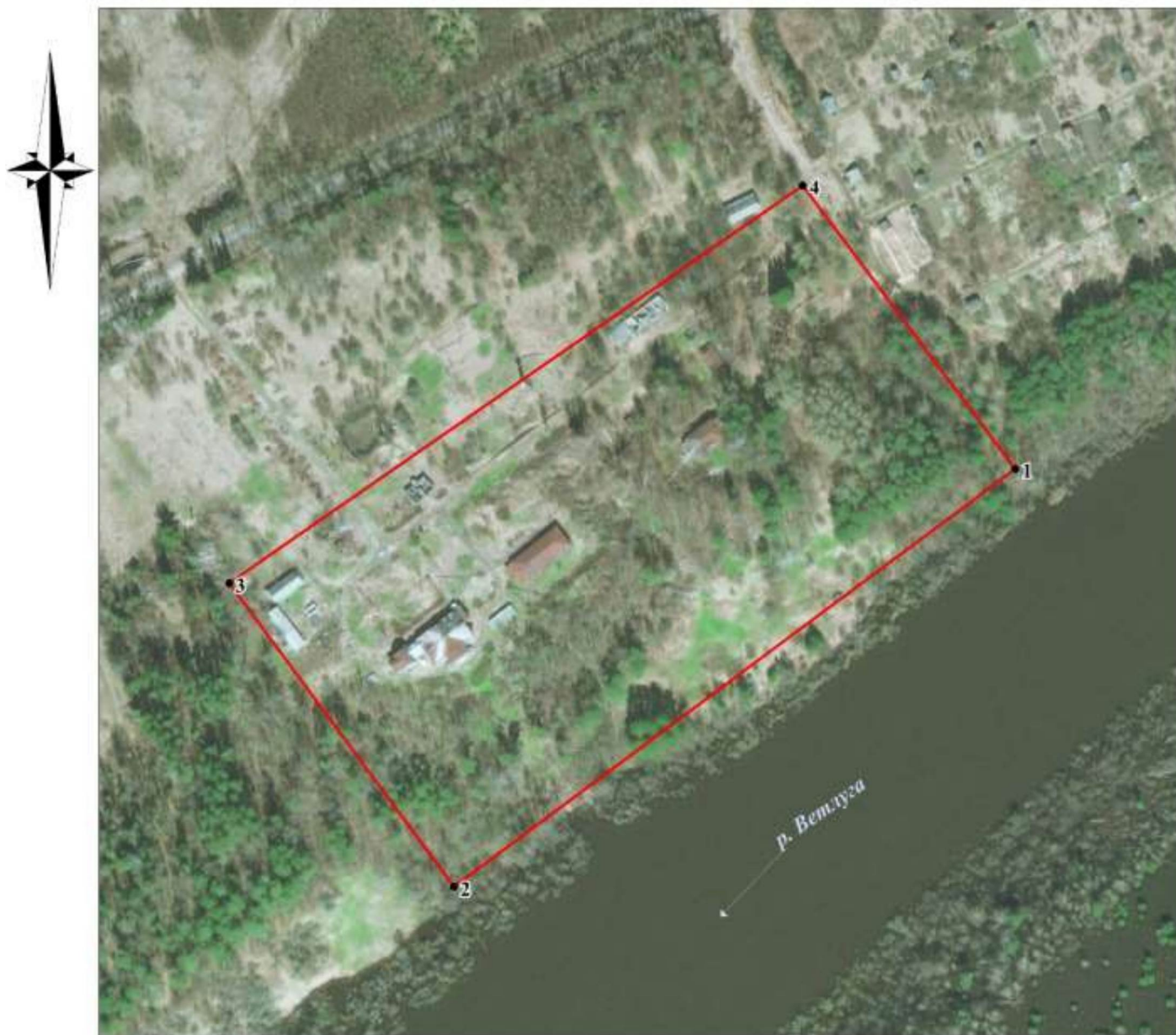
СХЕМА ГРАНИЦ ПАМЯТНИКА ПРИРОДЫ РЕГИОНАЛЬНОГО ЗНАЧЕНИЯ "ПАРК ВЕТЛУЖСКОГО ПРОТИВОТУБЕРКУЛЕЗНОГО САНАТОРИЯ"

Приложение 2 к паспорту на памятник природы регионального значения «Парк Ветлужского противотуберкулезного санатория», расположенный в Ветлужском муниципальном округе Нижегородской области