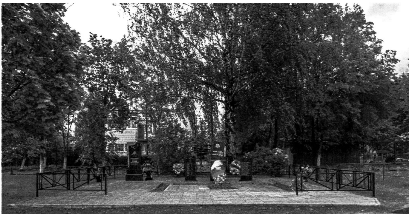
1. Вид на Объект с запада.

Фотофиксация объекта культурного наследия регионального значения «Братская могила советских воинов, 1941-1942 гг.» (далее – Объект)