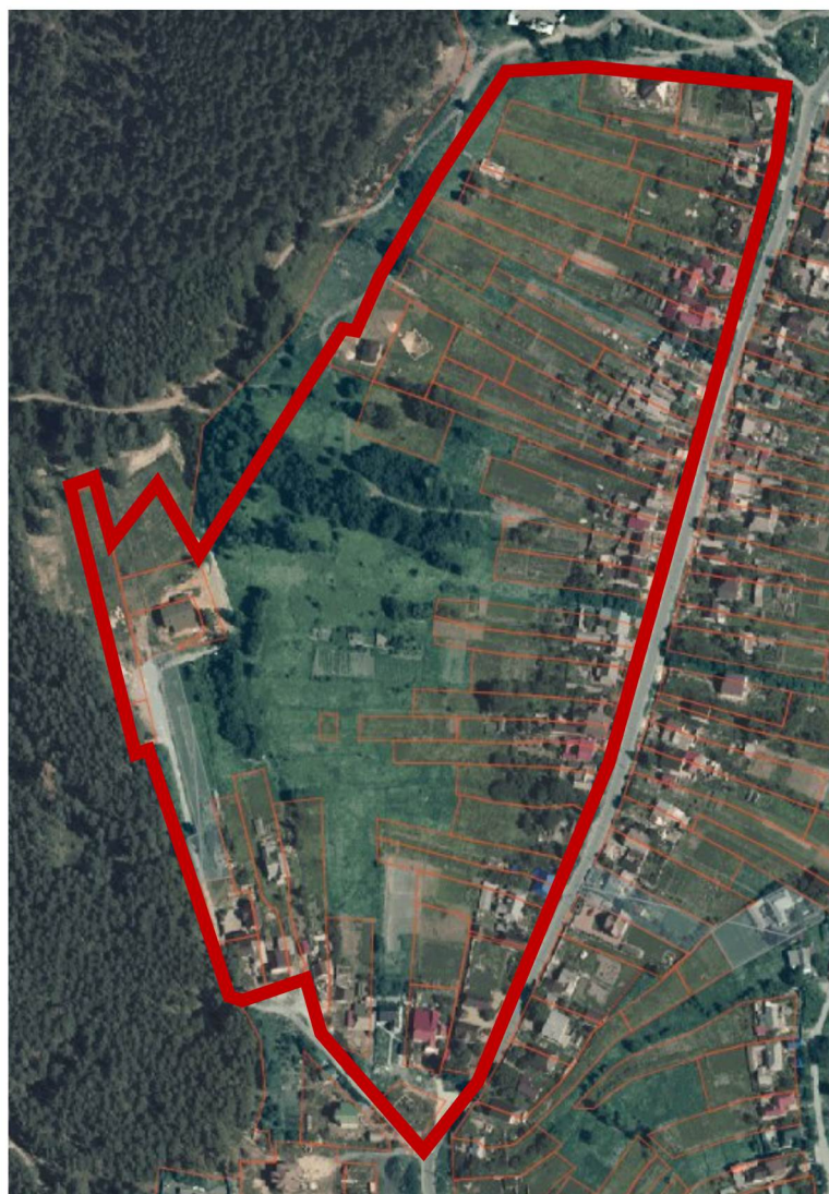
Схема границ территории для разработки документации по планировке территории (проект межевания территории в виде отдельного документа) в районе улицы Советская в городе Липецке (Сселки, квартал № 139)

к приказу министерства строительства и архитектуры Липецкой области «О принятии решения о подготовке документации по планировке территории (проект межевания территории в виде отдельного документа) в районе улицы Советская в городе Липецке (Сселки, квартал № 139)»