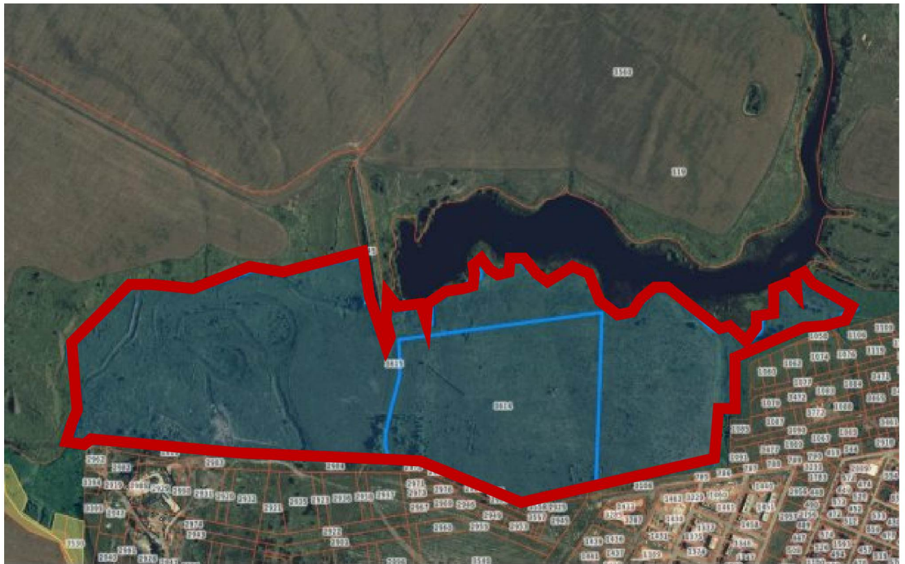
Схема границ территории для разработки документации по планировке территории (проект планировки территории, проект межевания территории в составе проекта планировки территории) в селе Подгорное Липецкого муниципального округа

к приказу министерства строительства и архитектуры Липецкой области «О принятии решения о подготовке документации по планировке территории (проект планировки территории, проект межевания территории в составе проекта планировки территории) в селе Подгорное Липецкого муниципального округа»