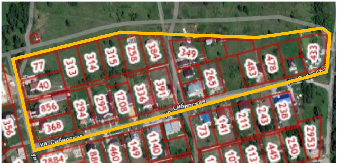
Схема границ территории для разработки документации по планировке территории (проект межевания территории в виде отдельного документа) в районе улиц И. Мазурука и Сибирская в городе Липецке (Сселки, квартал № 188)

к приказу министерства строительства и архитектуры Липецкой области «О принятии решения о подготовке документации по планировке территории (проект межевания территории в виде отдельного документа) в районе улиц И. Мазурука и Сибирская в городе Липецке (Сселки, квартал № 188)»