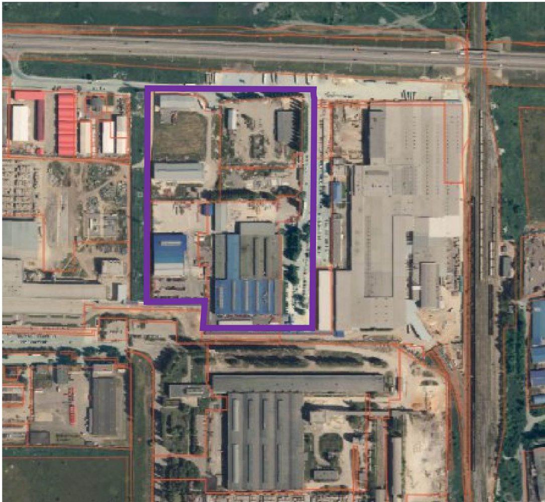
Схема границ территории для разработки документации по планировке территории (проект межевания территории в виде отдельного документа) в районе улицы Ковалева в городе Липецке, в части земельного участка с кадастровым номером 48:20:0021003:1

к приказу министерства строительства и архитектуры Липецкой области «О принятии решения о подготовке документации по планировке территории (проект межевания территории в виде отдельного документа) в районе улицы Ковалева в городе Липецке, в части земельного участка с кадастровым номером 48:20:0021003:1»