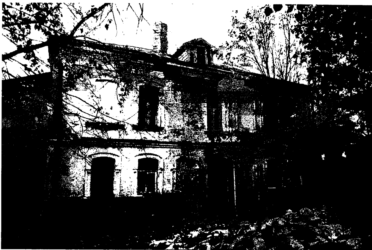
Фото 11. Юго-восточный фасад основного объема.