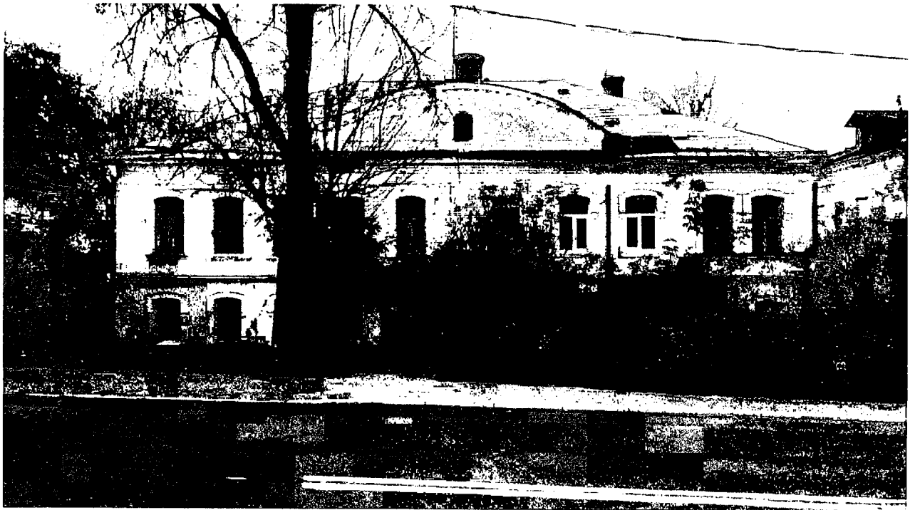
Фото 4. Уличный (северо-западный) фасад.