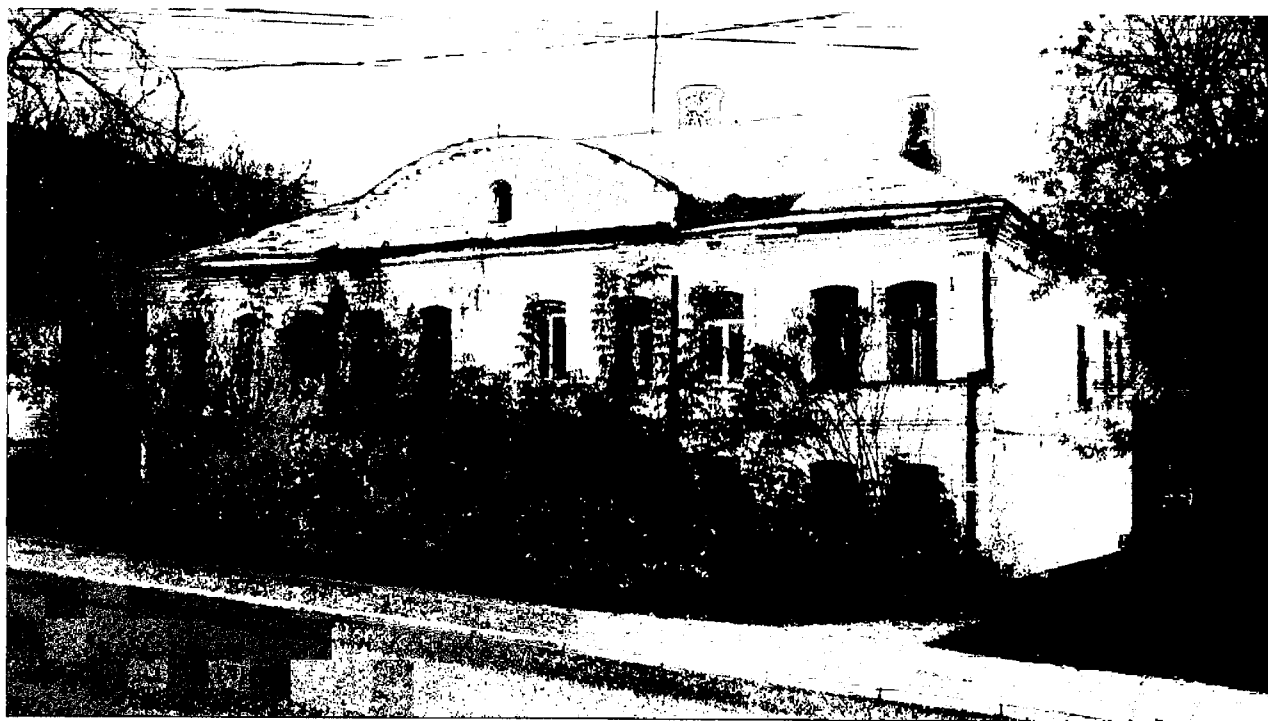
Фото 2. Вид с запада, с ул. Набережной.