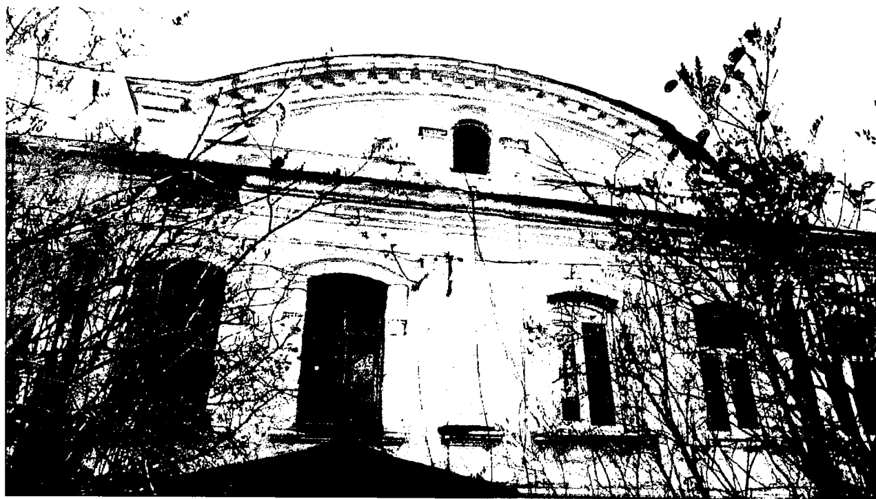
Фото 10. Оформление выпускного окна.