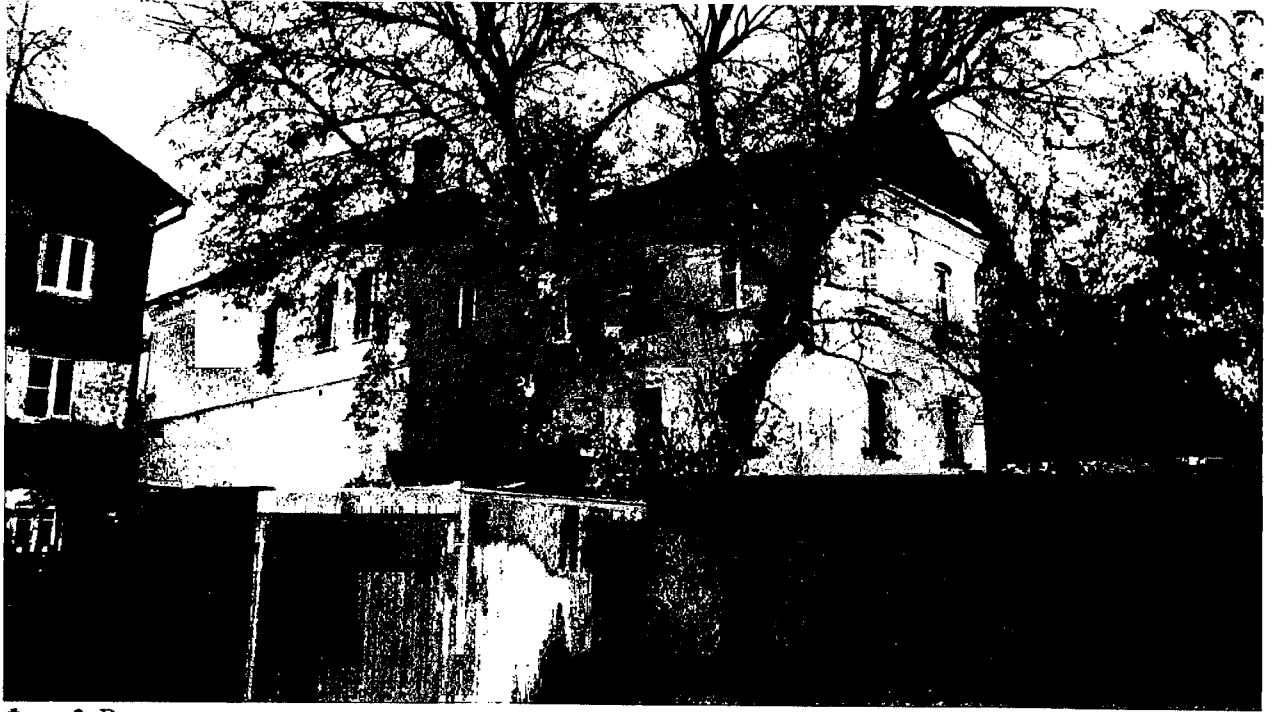
Фото 3. Вид с юга, со двора.