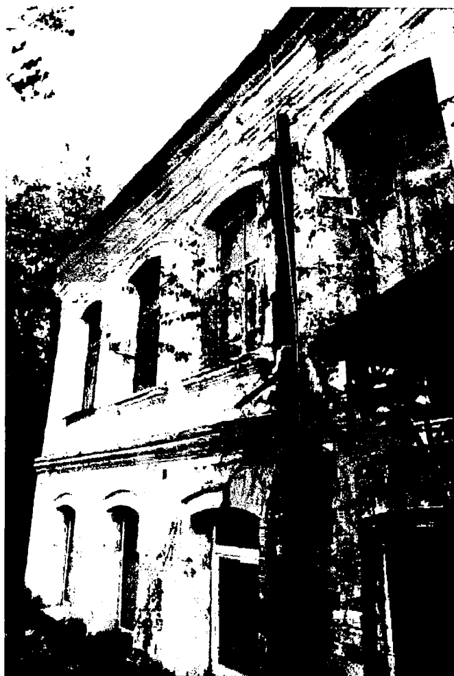
Фото 6. Оформление уличного фасада. Левая часть фасада.