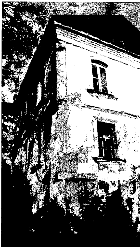
Фото 16. Южный угол дворовой пристройки.