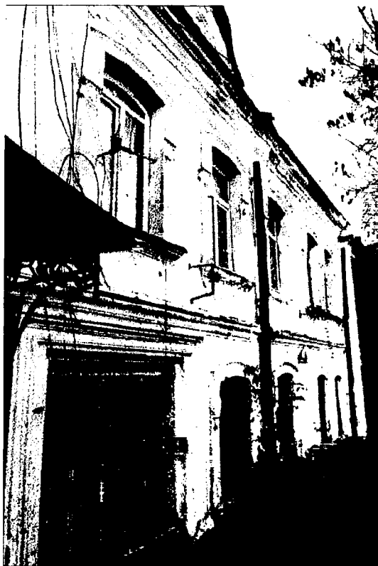
Фото 5. Оформление уличного фасада. Правая часть фасада.