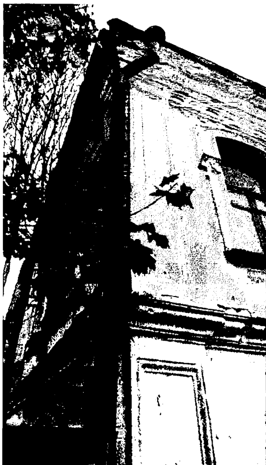
Фото 8. Оформление северного угла здания.