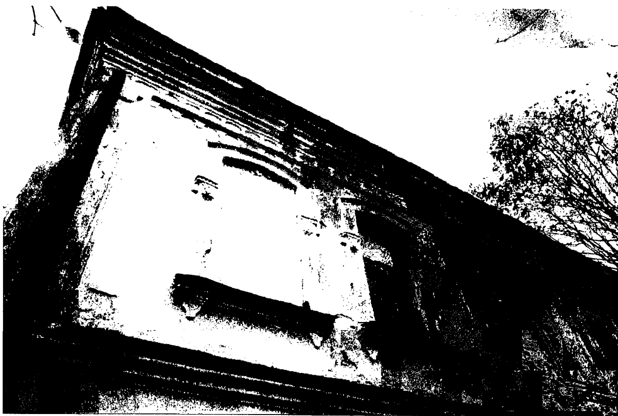
Фото 12. Фрагмент юго-восточного фасада основного объема.