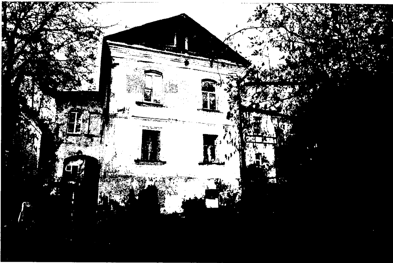
Фото 15. Юго-западный (дворовый) фасад.