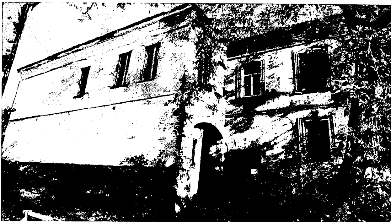
Фото 17. Юго-западный фасад.