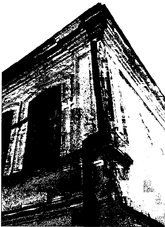
Фото 7. Оформление западного угла здания.