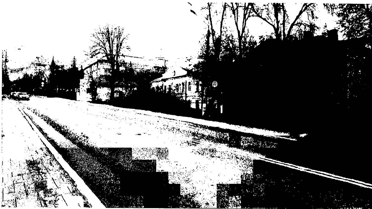
Фото 1. Дом (второй справа) в застройке ул. Набережная.