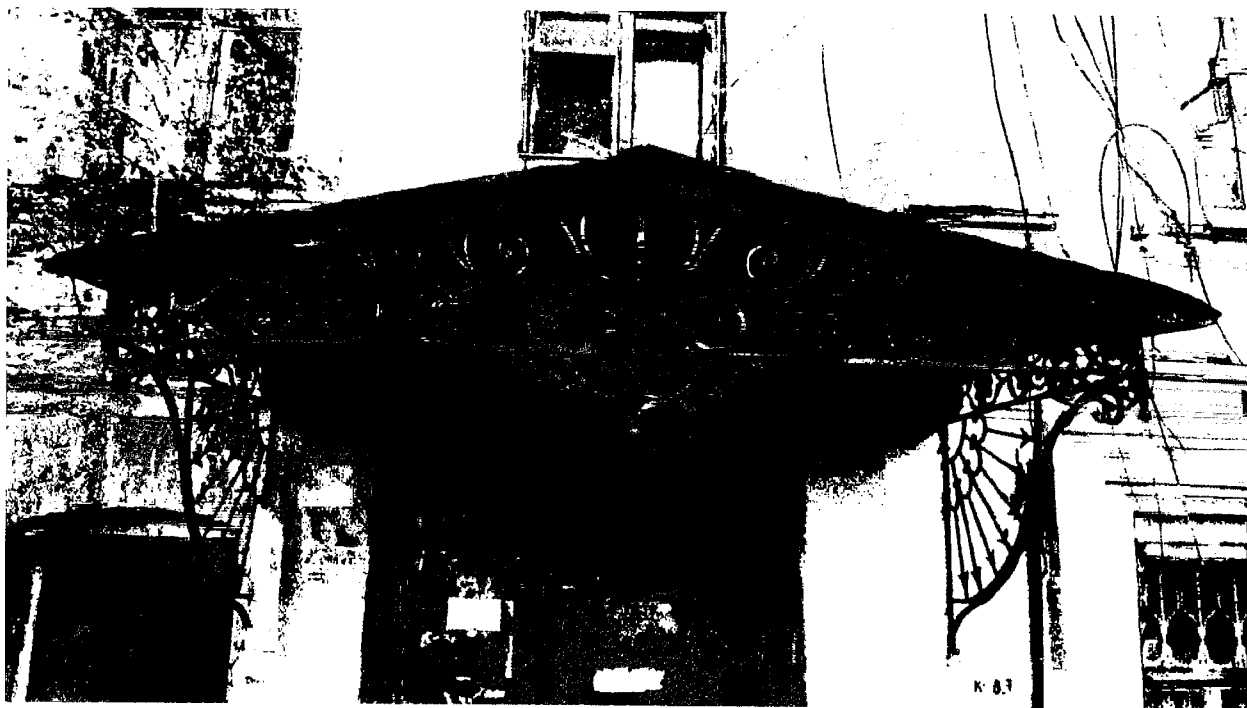
Фото 9. Козырек над входом.