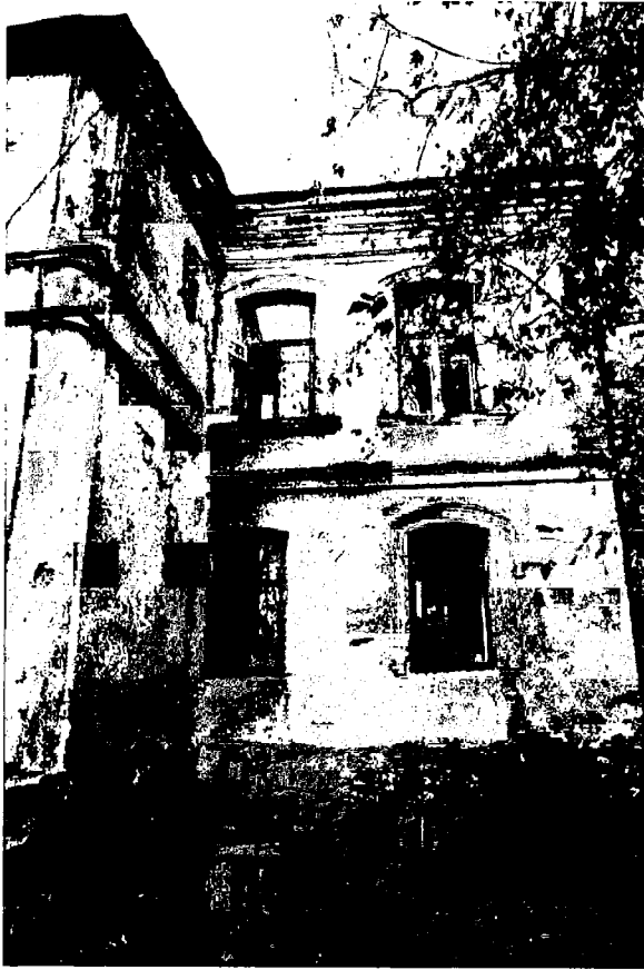
Фото 13. Юго-западный фасад. Правая часть – фасад основного объема.