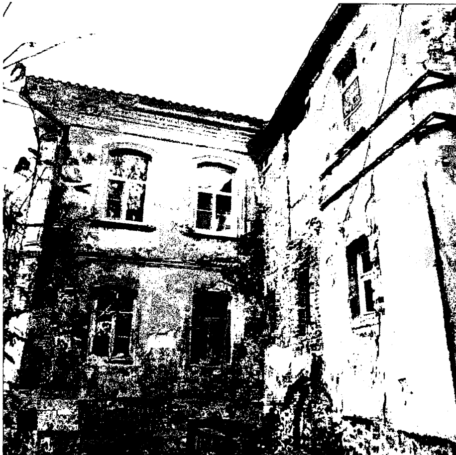
Фото 14. Юго-восточный фасад пристройки.