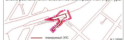
Схема расположения элементов планировочной структуры