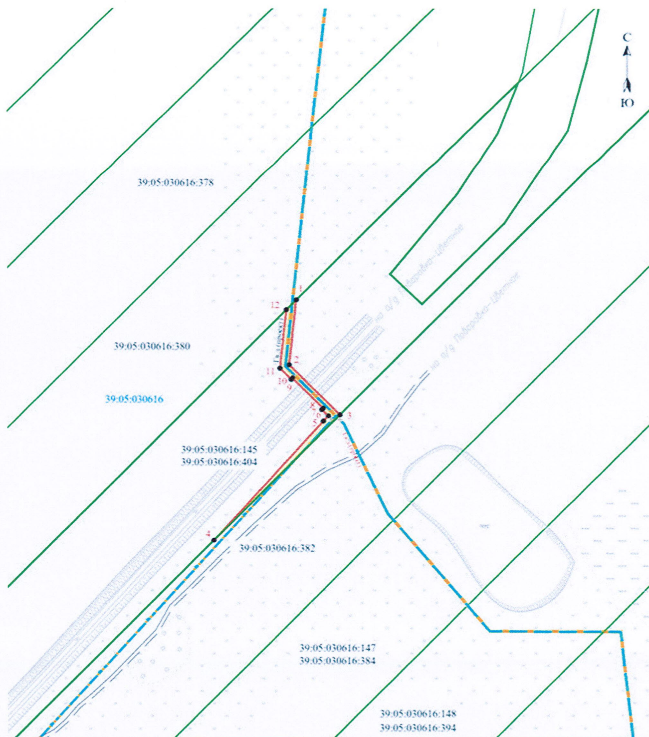
Схема расположения границ публичного сервитута (5-й этап)

Публичный сервитут в целях размещения 5-го этапа линейного объекта регионального значения: «Газопровод межпоселковый п. Поваровка – п. Морозовка – п. Путилово – п. Круглово – п. Тихорецкое – п. Нивы – п. Цветное (закольцовка с газопроводом межпоселковым на Балтийск)»