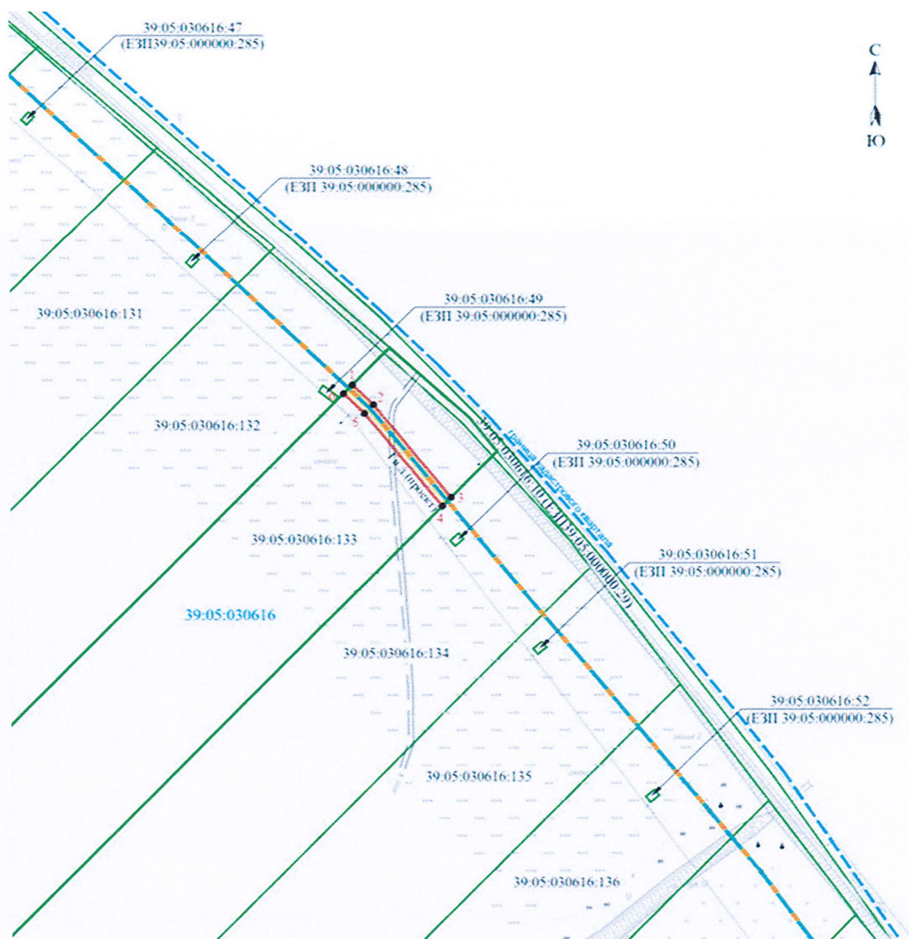
Схема расположения границ публичного сервитута (3-й этап)

Публичный сервитут в целях размещения 3-го этапа линейного объекта регионального значения: «Газопровод межпоселковый п. Поваровка – п. Морозовка – п. Путилово – п. Круглово – п. Тихореченское – п. Нивы – п. Цветное (закольцовка с газопроводом межпоселковым на Балтийск)»