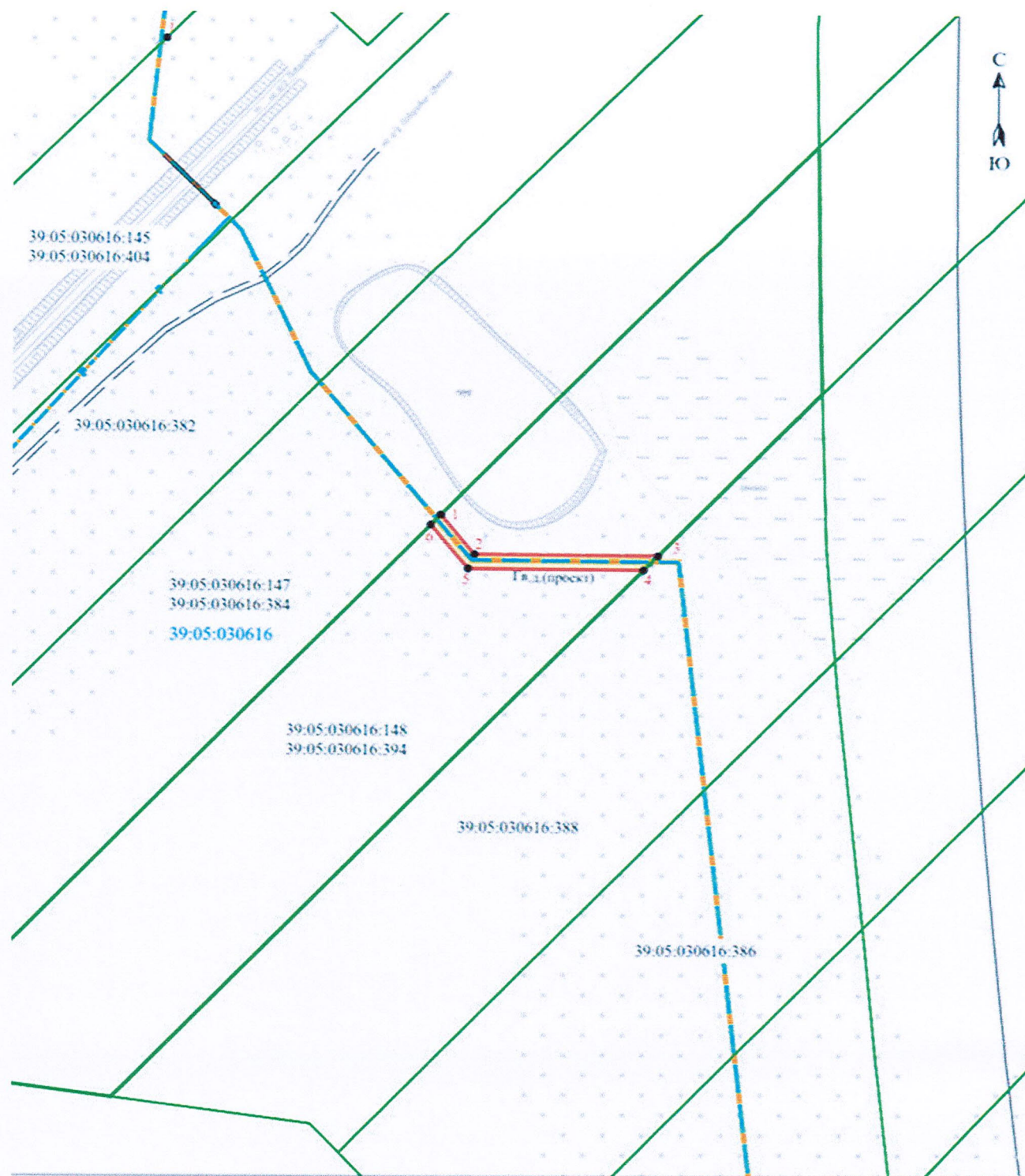
Схема расположения границ публичного сервитута (7-й этап)

Публичный сервитут в целях размещения 7-го этапа линейного объекта регионального значения: «Газопровод межпоселковый п. Поваровка – п. Морозовка – п. Путилово – п. Круглово – п. Тихореченское – п. Нивы – п. Цветное (закольцовка с газопроводом межпоселковым на Балтийск)»