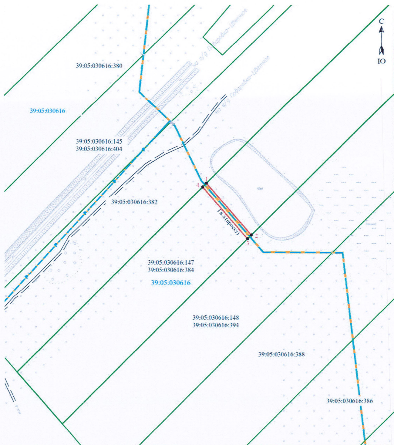
Схема расположения границ публичного сервитута (6-й этап)

Публичный сервитут в целях размещения 6-го этапа линейного объекта регионального значения: «Газопровод межпоселковый п. Поваровка – п. Морозовка – п. Путилово – п. Круглово – п. Тихореченское – п. Нивы – п. Цветное (закольцовка с газопроводом межпоселковым на Балтийск)»