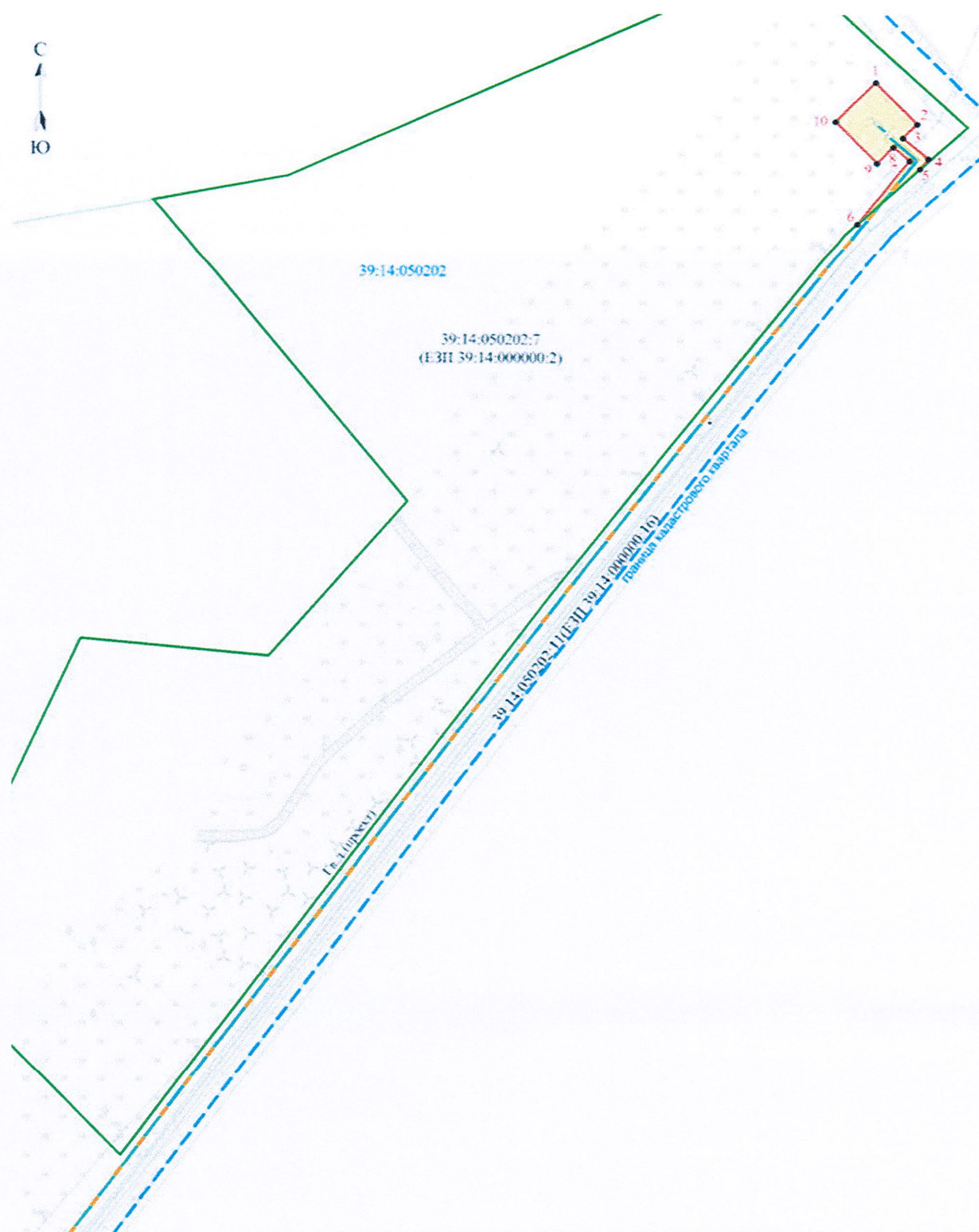
Схема расположения границ публичного сервитута (8-й этап)

Публичный сервитут в целях размещения 8-го этапа линейного объекта регионального значения: «Газопровод межпоселковый п. Поваровка — п. Морозовка — п. Путилово — п. Круглово — п. Тихореченское — п. Нивы — п. Цветное (закольцовка с газопроводом межпоселковым на Балтийск)»