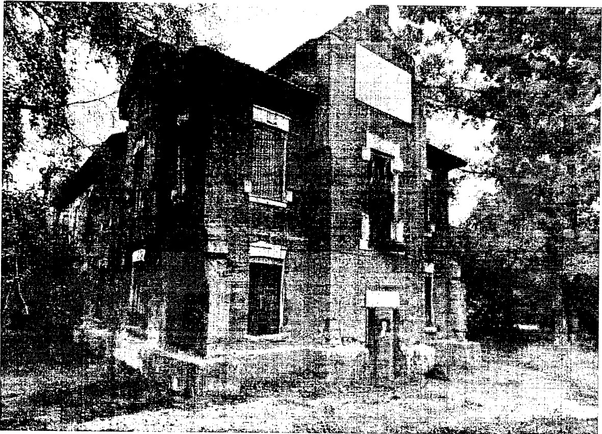
Фото 1 – Главный юго-восточный фасад, обращенный в переулок

Приложение к предмету охраны объекта культурного наследия регионального значения «Общественное здание», 1907-1908 гг., расположенного по адресу: Иркутская область, городской округ город Иркутск, город Иркутск, переулок Деповский, дом 4