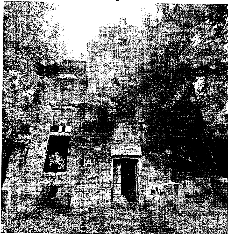
Фото 3 – Дворовой северо-западный фасад