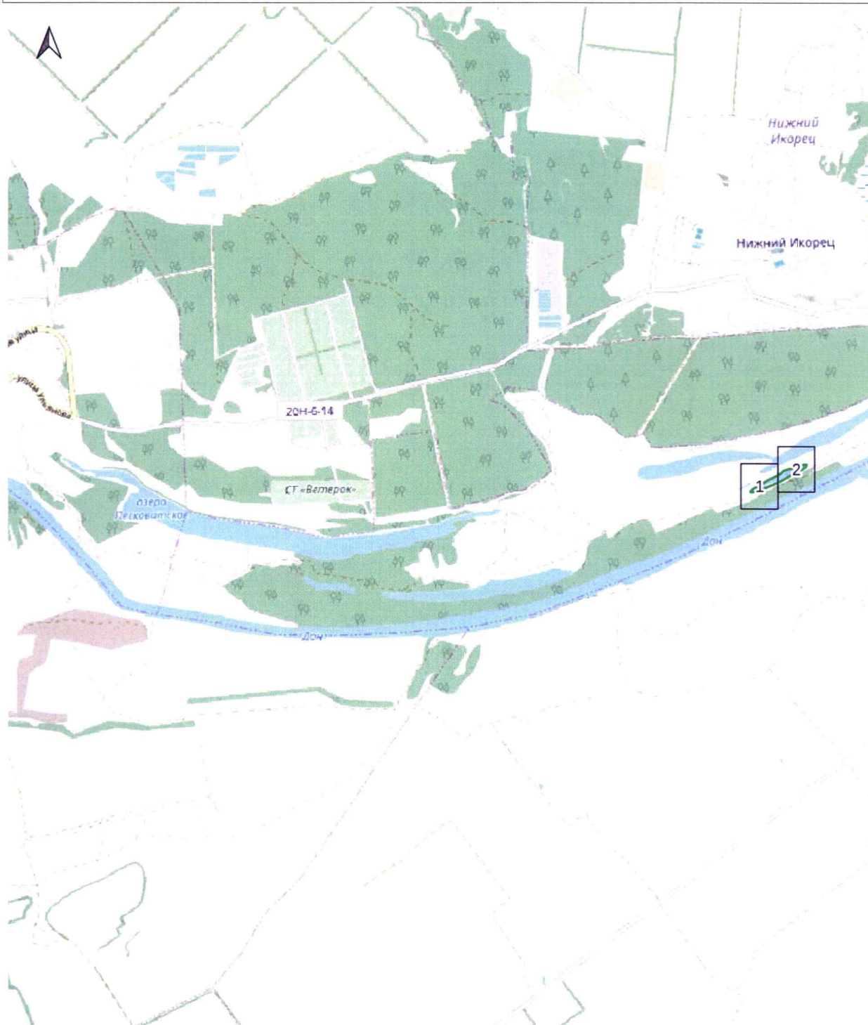
Схема выносных листов