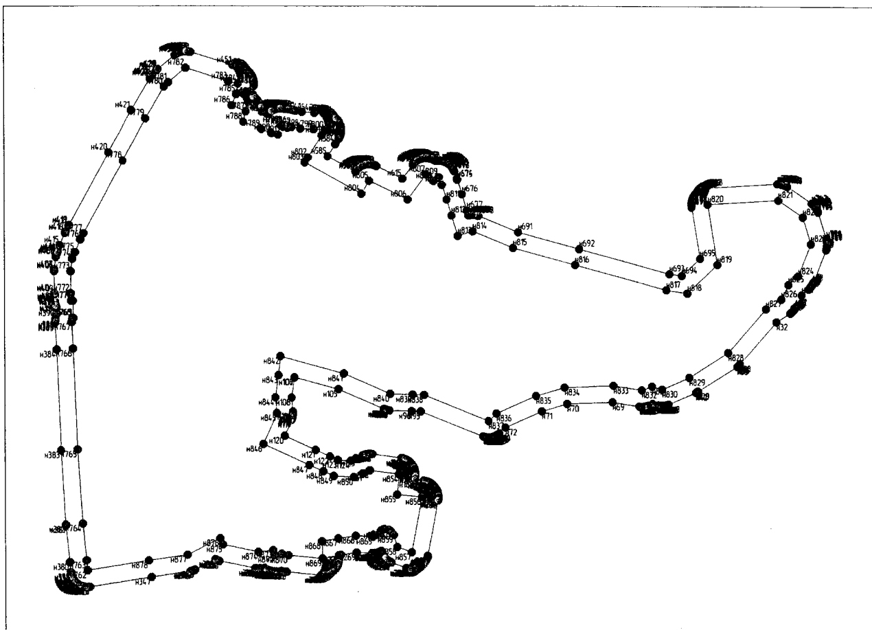
Масштаб 1: 4500

Используемые условные знаки и обозначения: