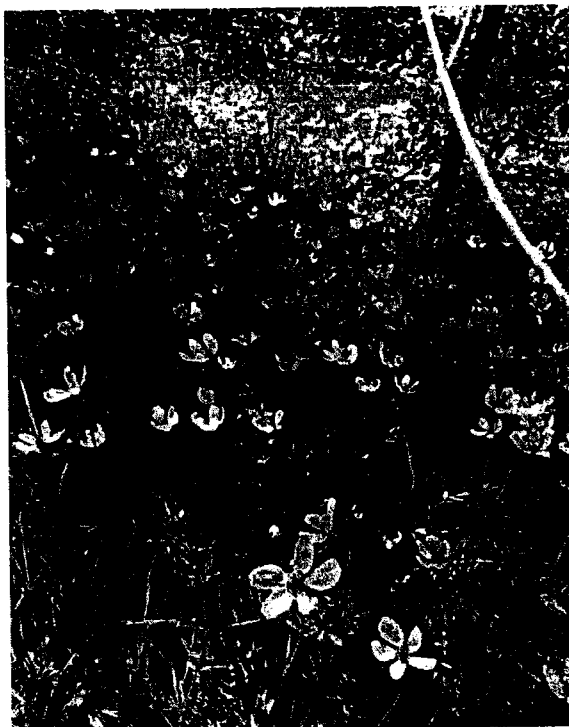
Рисунок 5. Ветреница лесная