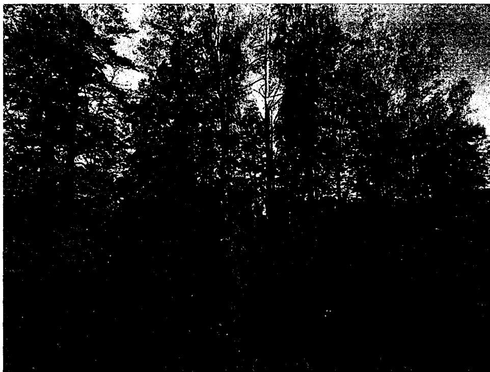
Рисунок 1. Общий вид на памятник природы «Орловские дворики» (фото июль 2024 года)

ного мира, занесенных в Красную книгу Российской Федерации и Красную книгу Брянской области) на момент составления Положения: