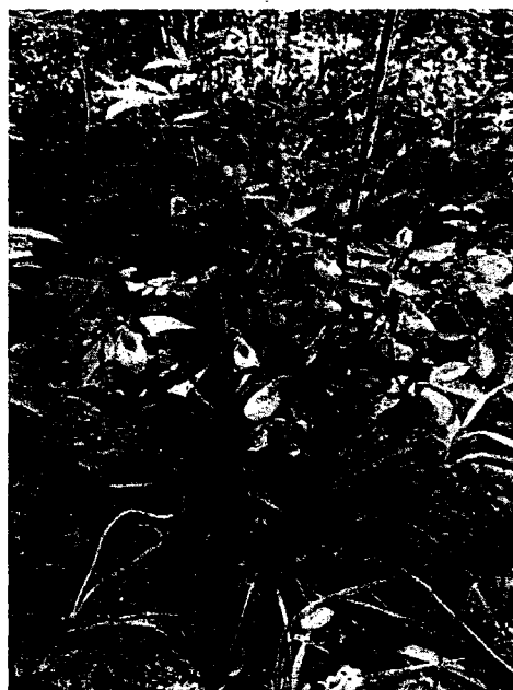
Рисунок 2. Венерин башмачок настоящий