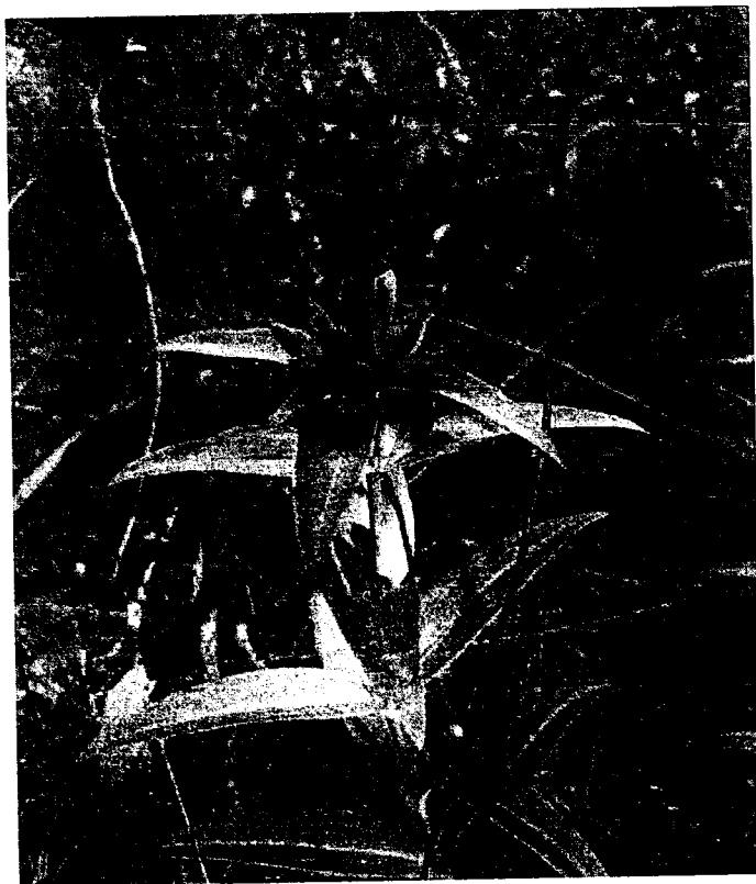
Рисунок 7. Горечавка крестовидная