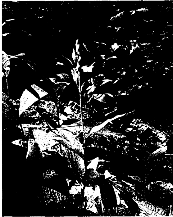
Рисунок 3. Пыльцеголовник красный