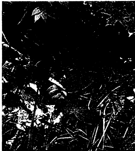
Рисунок 4. Тайник яйцевидный