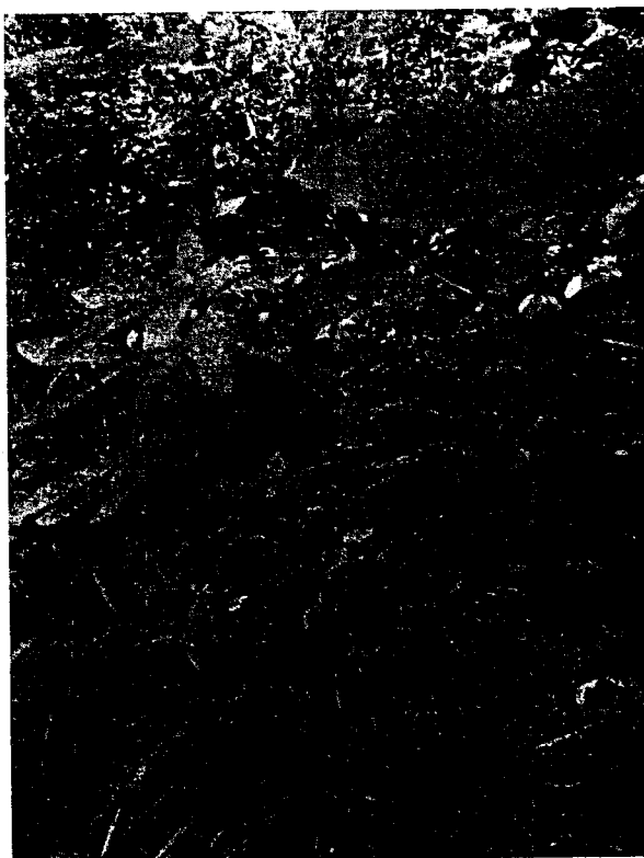
Рисунок 6. Волчегодник обыкновенный