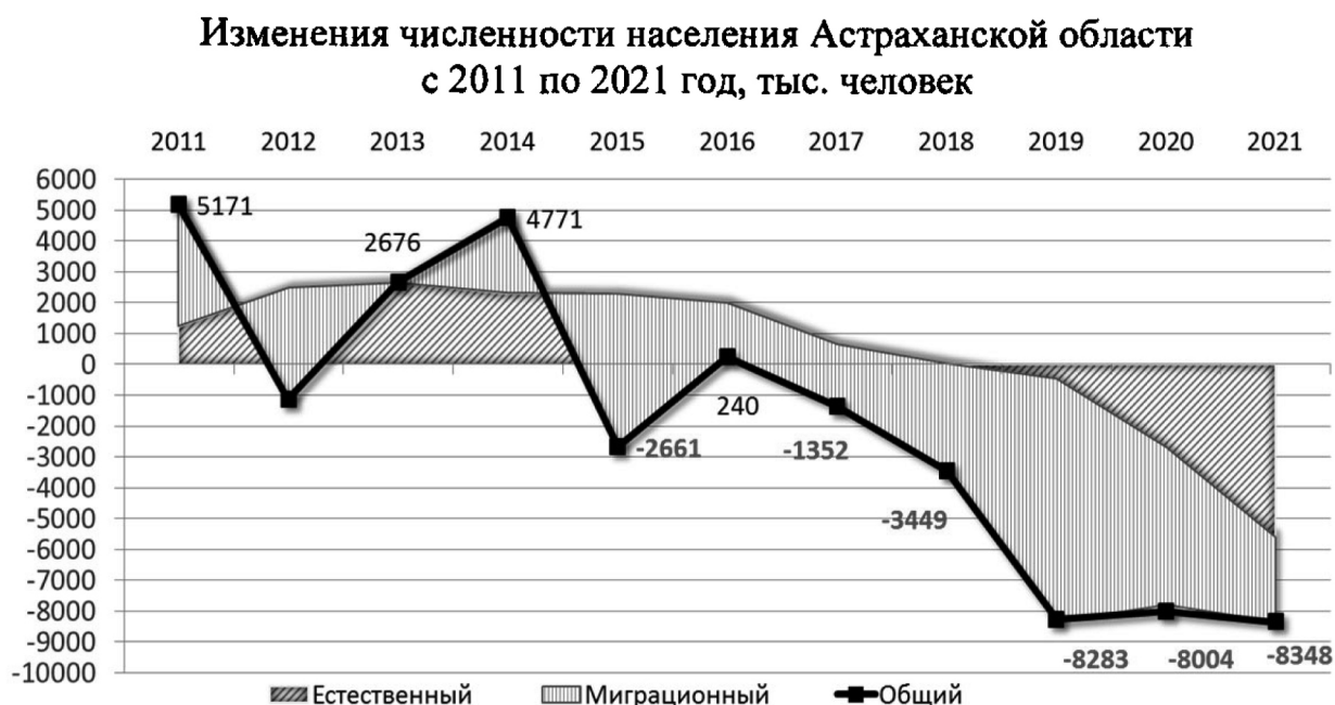
График № 2

В последние пять лет причиной снижения численности населения Астраханской области является миграционная убыль, имеющая устойчивый характер. Наиболее наглядно миграционная убыль населения Астраханской области представлена на графике № 2.