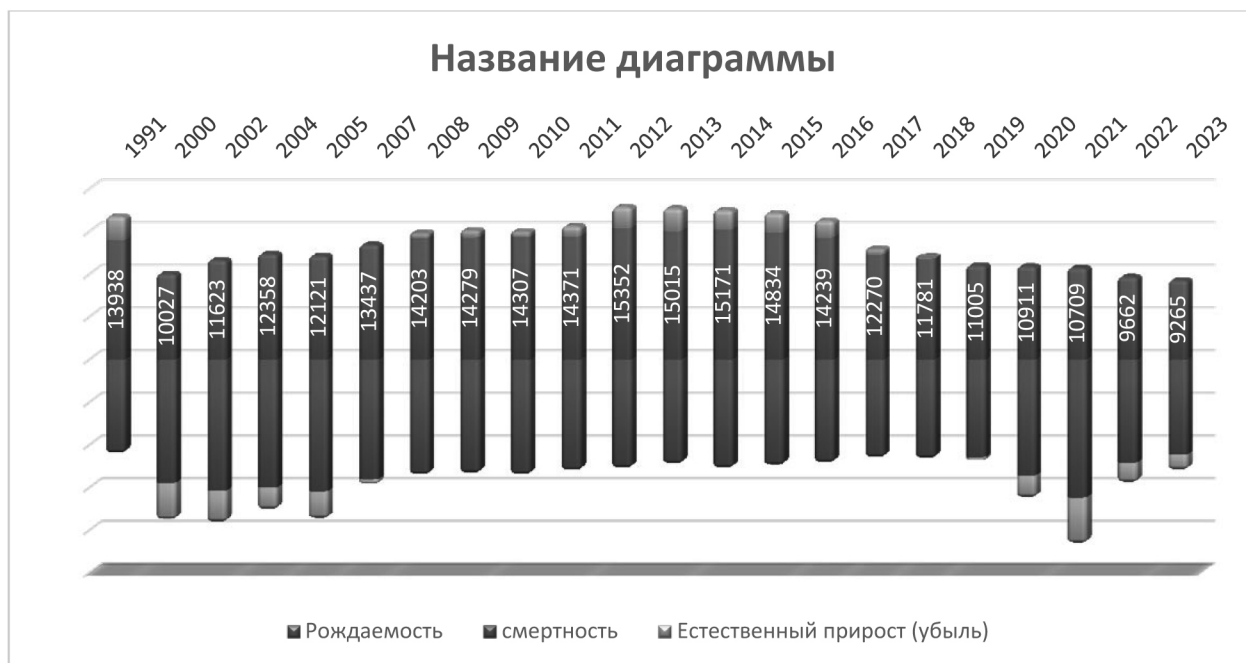
График № 3

В таблице № 22 представлен наибольший коэффициент рождаемости по Астраханской области в 2016 году (14,0), далее темп снижения показателя замедлился: в 2018 году – 11,6, в 2019 году – 10,9, а в 2020 году показатель сохранился на уровне 2019 года, что позволило Астраханской области оставаться в числе регионов с общим коэффициентом рождаемости, превышающим средний по Южному федеральному округу (график № 4).