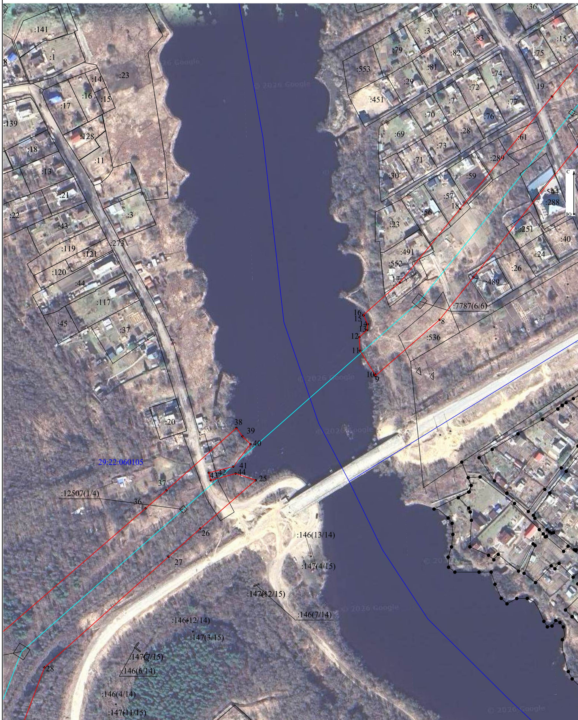
Схема расположения границ публичного сервитута объекта электросетевого хозяйства: «отпайка на ПС «Ломоносовская» от ВЛ-110кВ Жаровиха-1,2», расположенного по адресу: Архангельская область, г.Архангельск