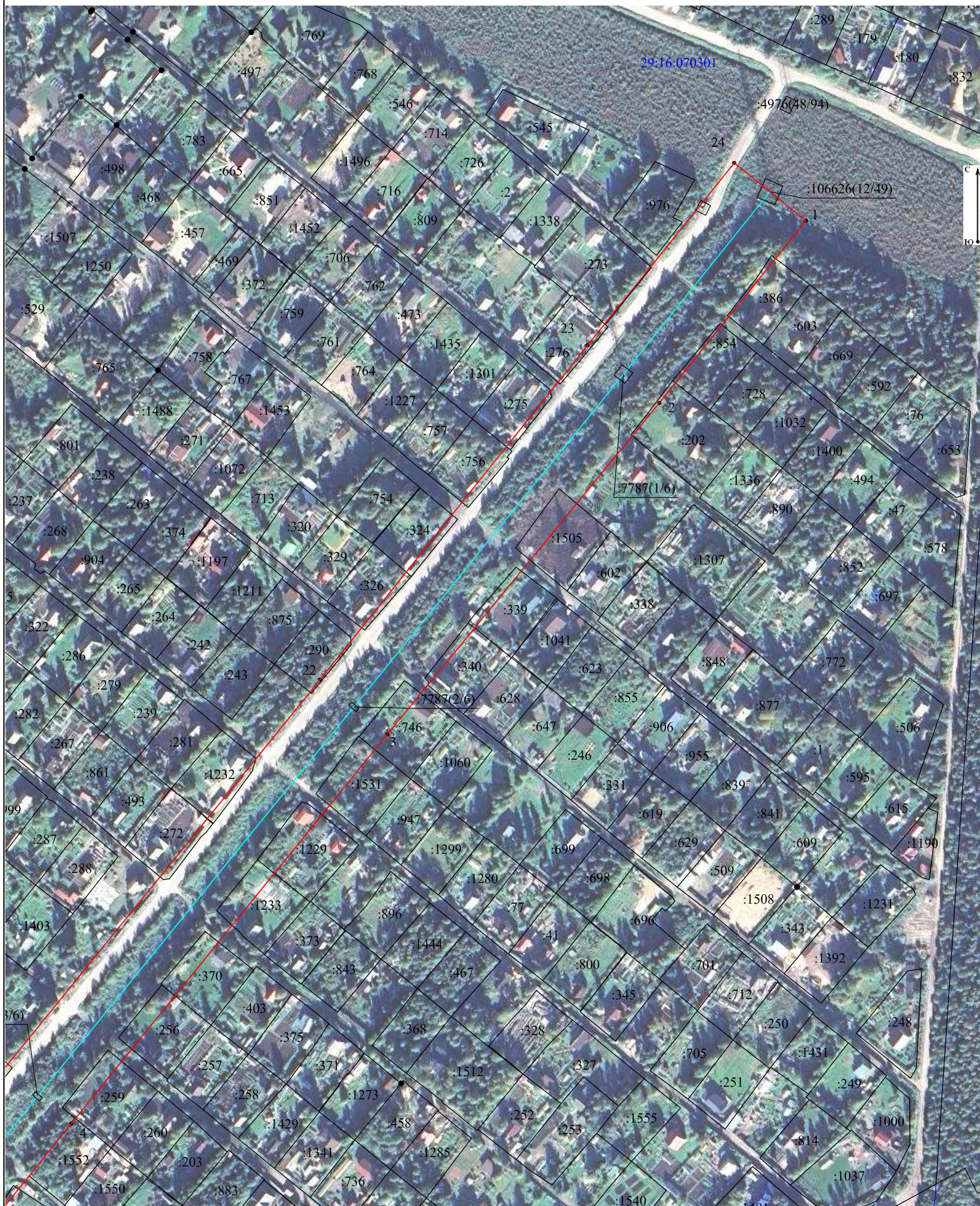
Схема расположения границ публичного сервитута объекта электросетевого хозяйства: «отпайка на ПС «Ломоносовская» от ВЛ-110кВ Жаровиха-1,2», расположенного по адресу: Архангельская область, г.Архангельск