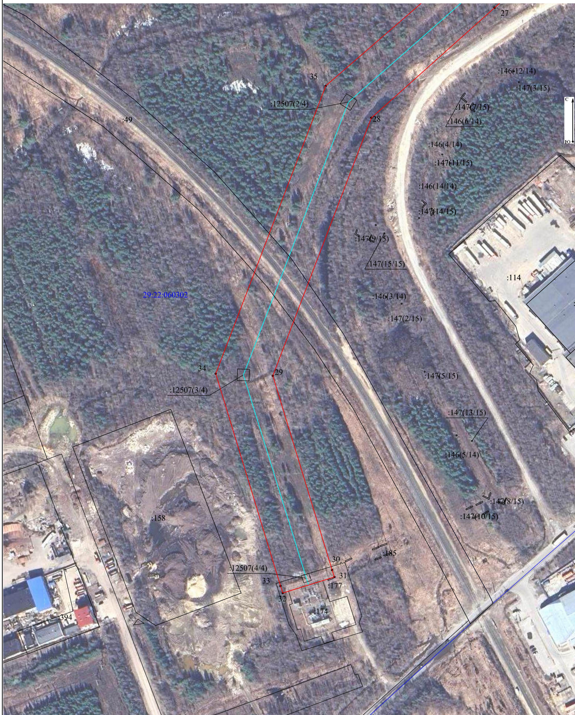
Схема расположения границ публичного сервитута объекта электросетевого хозяйства: «отпайка на ПС «Ломоносовская» от ВЛ-110кВ Жаровиха-1,2», расположенного по адресу: Архангельская область, г.Архангельск