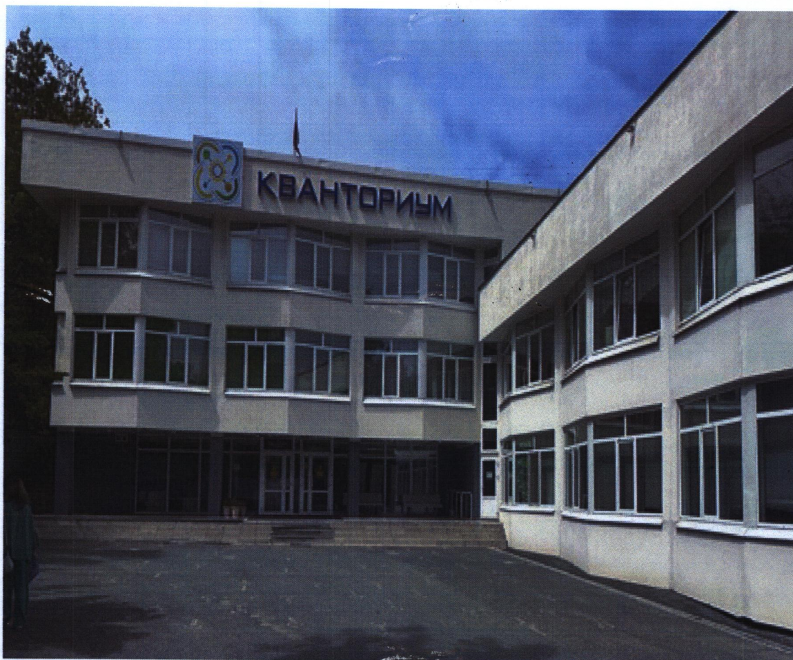
Фрагмент фасада (входная группа)