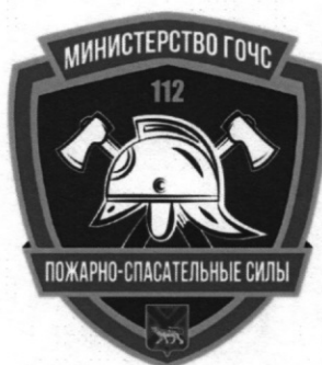
РИСУНОК ведомственной награды