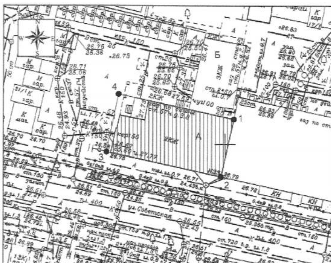
Карта (схема) границ территории объекта культурного наследия

территории объекта культурного наследия регионального значения «Особняк К.П. и Х.П. Богарсуковых», 1910 г., Краснодарский край, г. Краснодар, ул. Советская, 33, лит. А