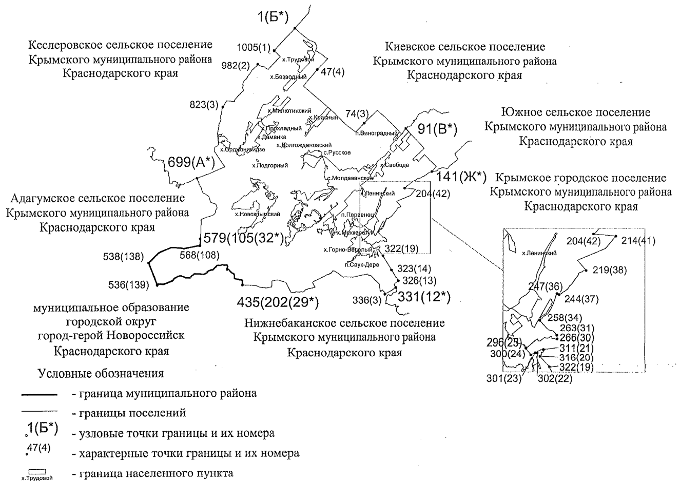
КАРТА-СХЕМА границ Молдаванского сельского поселения Крымского муниципального района Краснодарского края

к Закону Краснодарского края "Об установлении границ муниципального образования Крымский муниципальный район Краснодарского края, наделении его статусом муниципального района, образовании в его составе муниципальных образований — городского и сельских поселений — и установлении их границ"