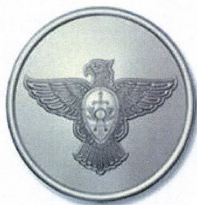
Диаметр 22 мм

Пуговицы для старшей категории работников организации специальной почтовой связи: