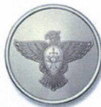
Диаметр 14 мм

Пуговицы для младшей категории работников организации специальной почтовой связи: