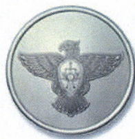
Диаметр 14 мм

Пуговицы для младшей категории работников организации специальной почтовой связи: