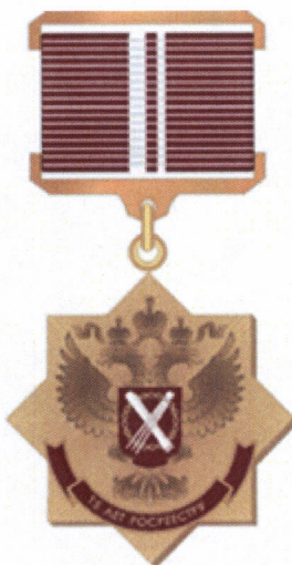
Рисунок нагрудного знака Федеральной службы государственной регистрации, кадастра и картографии «15 лет Росреестру»

Колодка на оборотной стороне имеет булавку для крепления нагрудного знака к одежде.