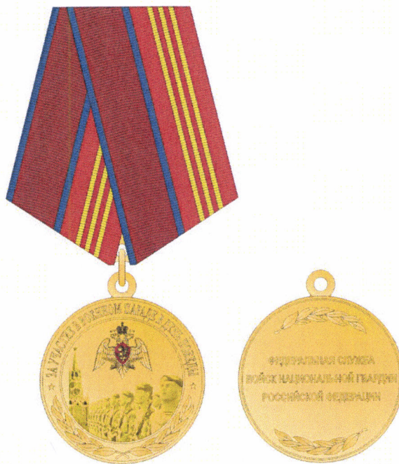
лицевая сторона обратная сторона

официального геральдического знака – памятной медали Федеральной службы войск национальной гвардии Российской Федерации «За участие в военном параде в День Победы»