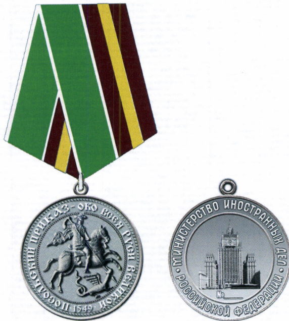
Рисунок нагрудной медали Министерства иностранных дел Российской Федерации «Посольский приказ»

Приложение № 2 к Положению о нагрудной медали Министерства иностранных дел Российской Федерации «Посольский приказ», утвержденному приказом МИД России от «31» мая 2021 г. № 9730