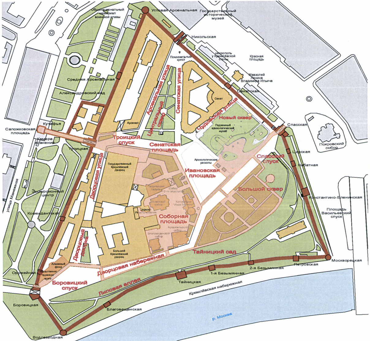
СХЕМА размещения объектов улично-дорожной сети, парково-садовых территорий и туристической зоны Московского Кремля