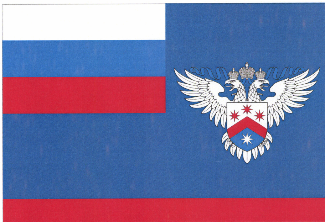
Рисунок флага Федеральной службы по интеллектуальной собственности

Приложение № 5 к приказу Минэкономразвития России от 04.12. 2019 г. № 784