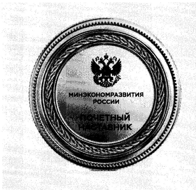
Рисунок ведомственного знака отличия Министерства экономического развития Российской Федерации «Почетный наставник Министерства экономического развития Российской Федерации»