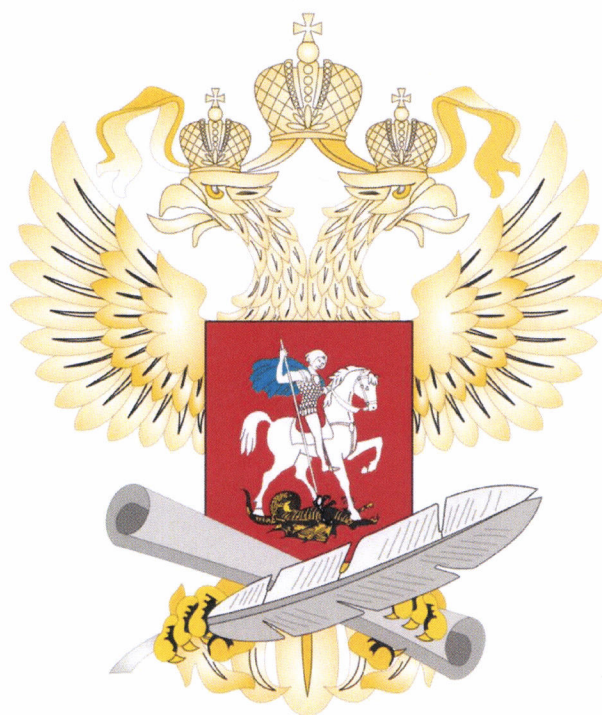
Рисунок геральдического знака – малой эмблемы Министерства просвещения Российской Федерации